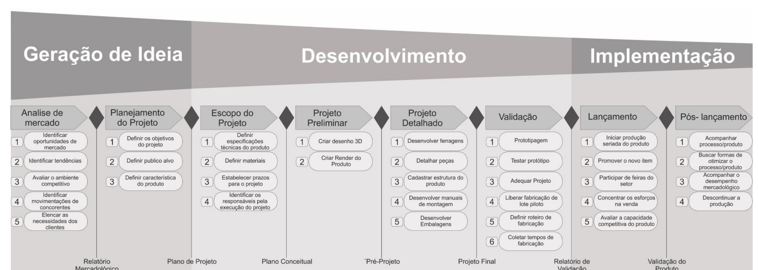
Figura 3 Metodologia de PDP Proposta

Na sequência, estruturou-se, baseado nas metodologias de PDP abordadas na revisão de literatura, um processo de desenvolvimento de produtos voltado às necessidades da empresa (Figura 3).