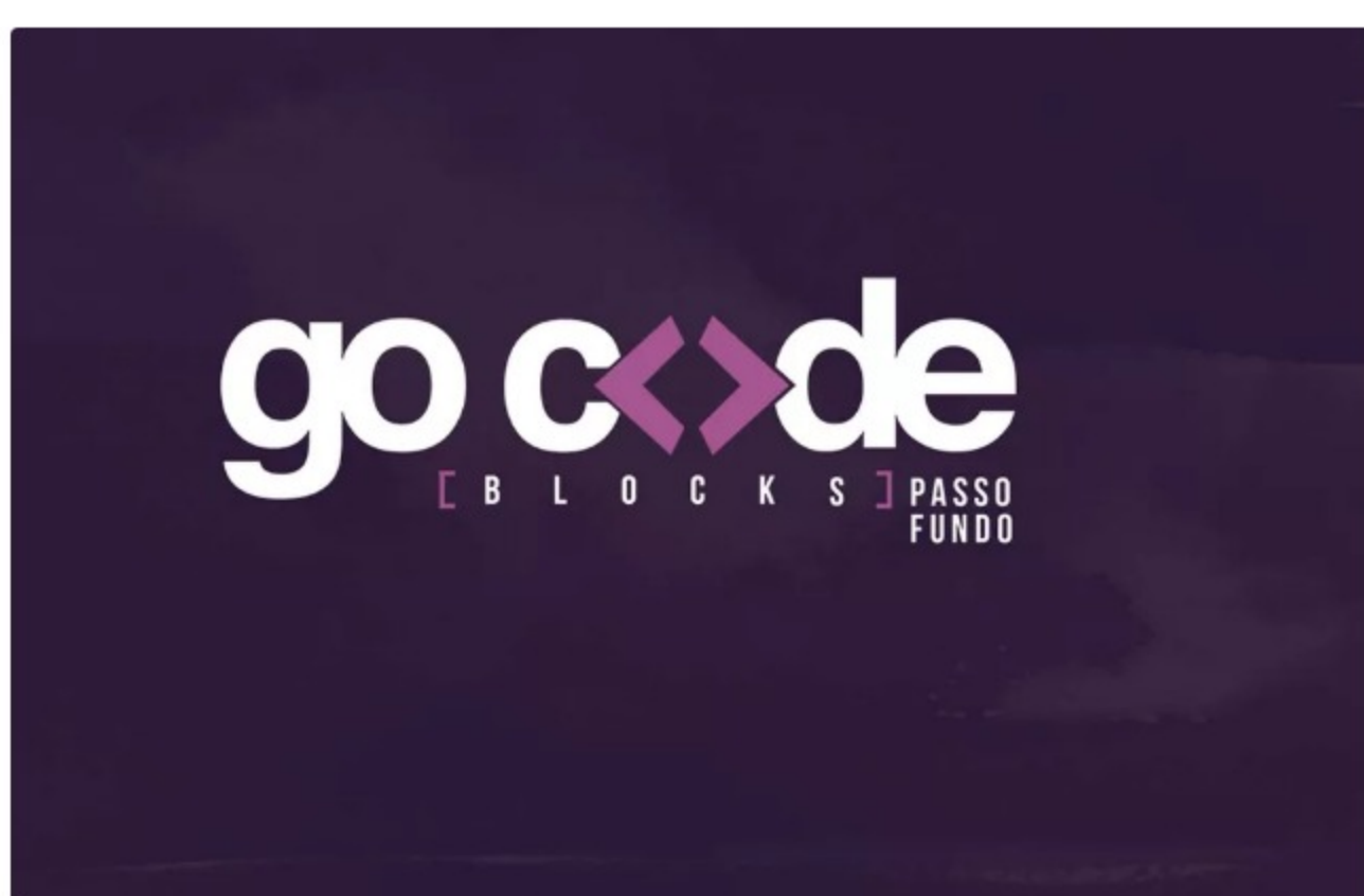
Projeto é voltado para alunos do ensino médio da rede pública de Passo Fundo

Por RBS TV 08/08/2018 11h04 - Atualizado há 21 horas