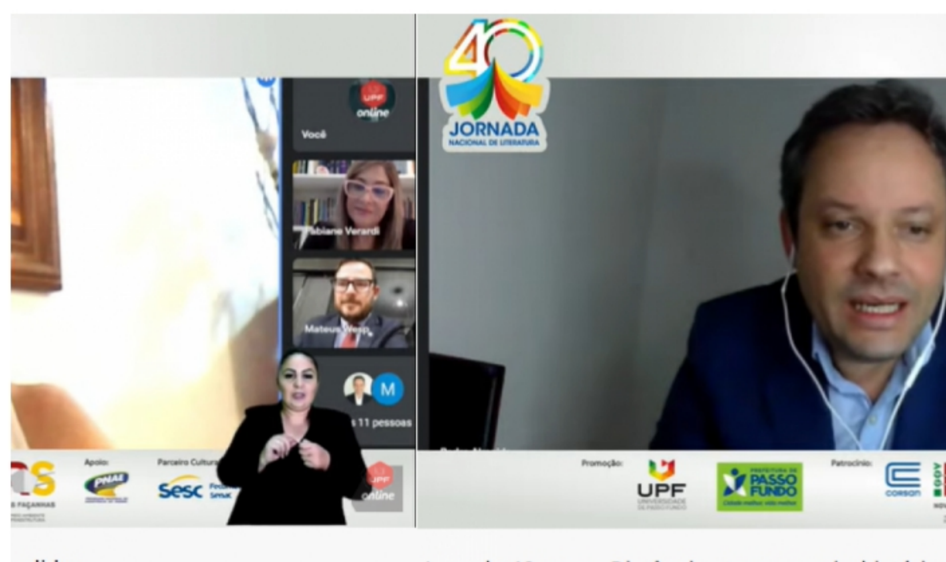
relidas Jornada 40 anos - Distâncias transversais, histórias