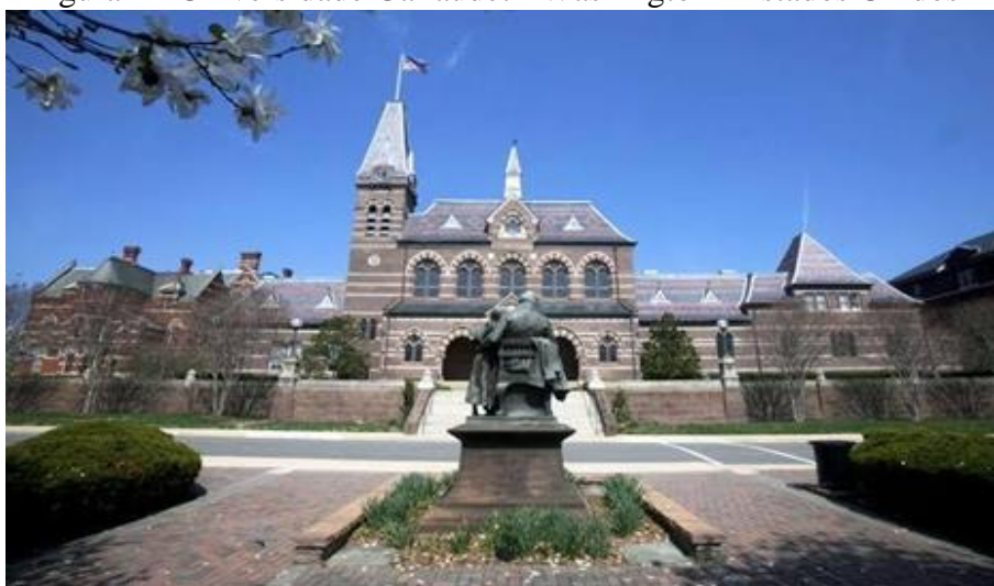
Figura 2 - Universidade Gallaudet - Washington - Estados Unidos