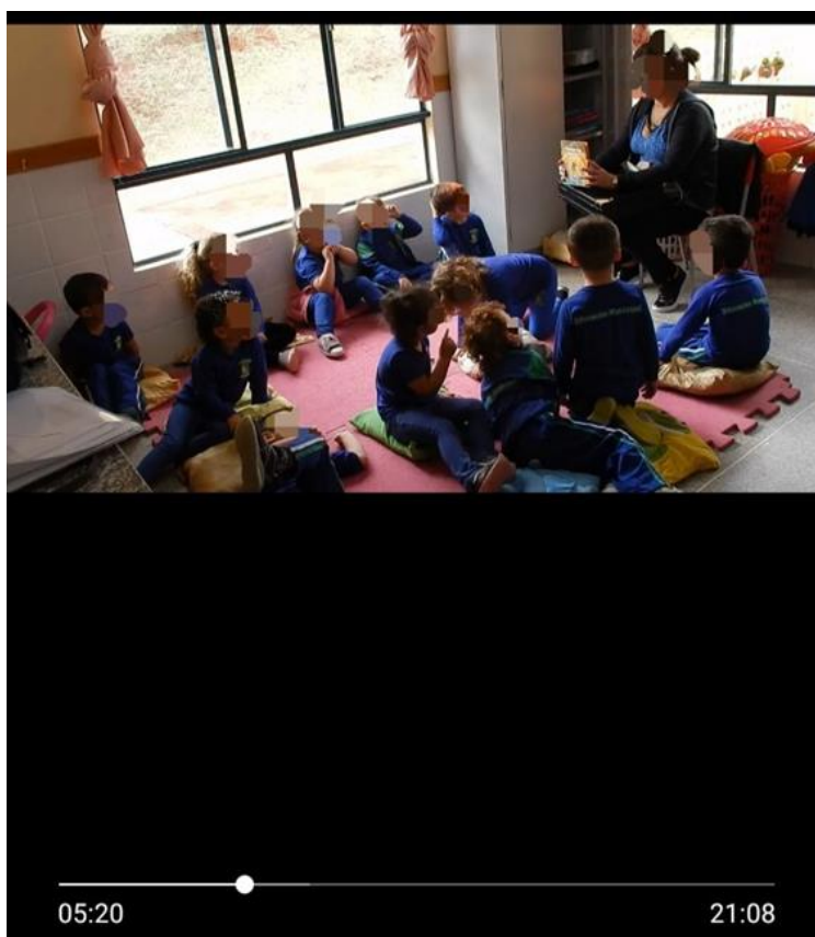
Imagem 1 - transcrição de dados