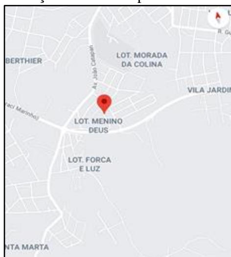
Figura 3 - Localização dos bairros próximos da Escola X

A Escola X atende crianças moradoras dos bairros Menino Deus, Loteamento Força e Luz e Santo Afonso, Bairro Santa Marta e Vila Jardim, da cidade de Passo Fundo - RS.