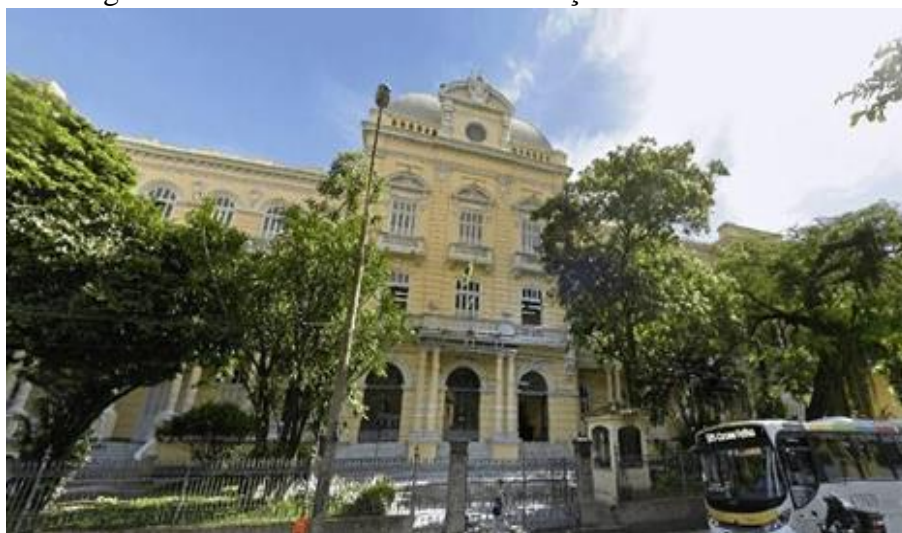
Figura 1 - Instituto Nacional de Educação de Surdos - INES