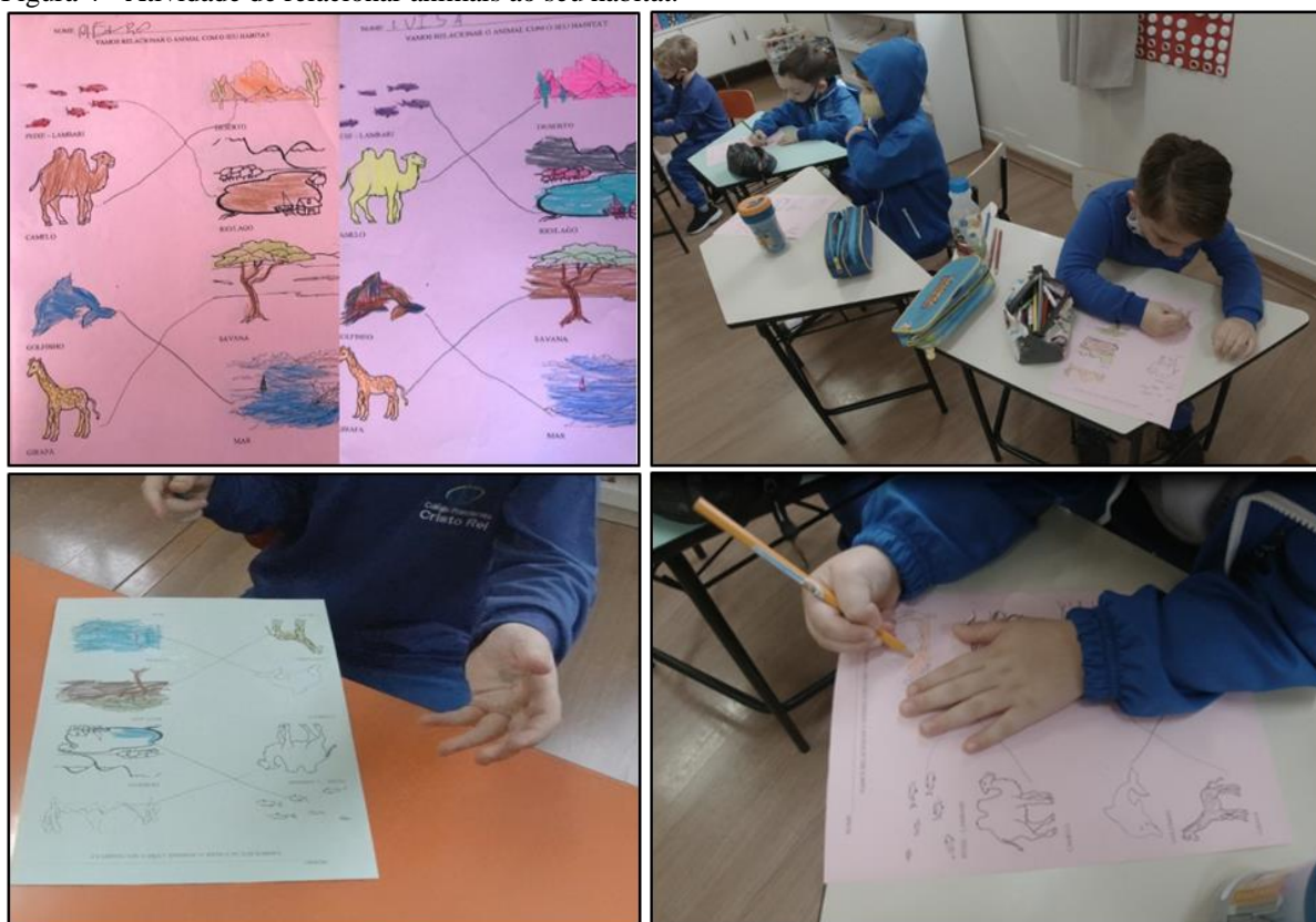
Figura 4 - Atividade de relacionar animais ao seu habitat.

O vídeo estava relacionado ao habitat e às necessidades dos animais para sobreviver, o que oportunizou que, na sequência, as crianças fossem instigadas a realizar uma tarefa para relacionar o animal ao seu habitat e a colorir alguns desenhos que lhes entregamos. A Figura 4 ilustra esse momento.