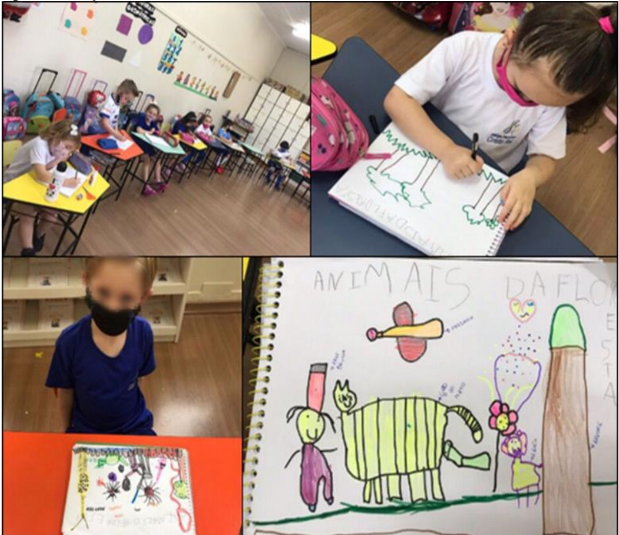
Figura 3 - Produção de desenho sobre os animais da floresta.

Ao retornar para a sala de aula, propôs-se que, no caderno de atividades, eles fizessem um desenho dos “animais da floresta”, tendo por base ou inspiração a história e a roda de conversa. A escolha de como seria o desenho ficava a critério de cada estudante. A Figura 3 mostra alguns momentos das atividades.