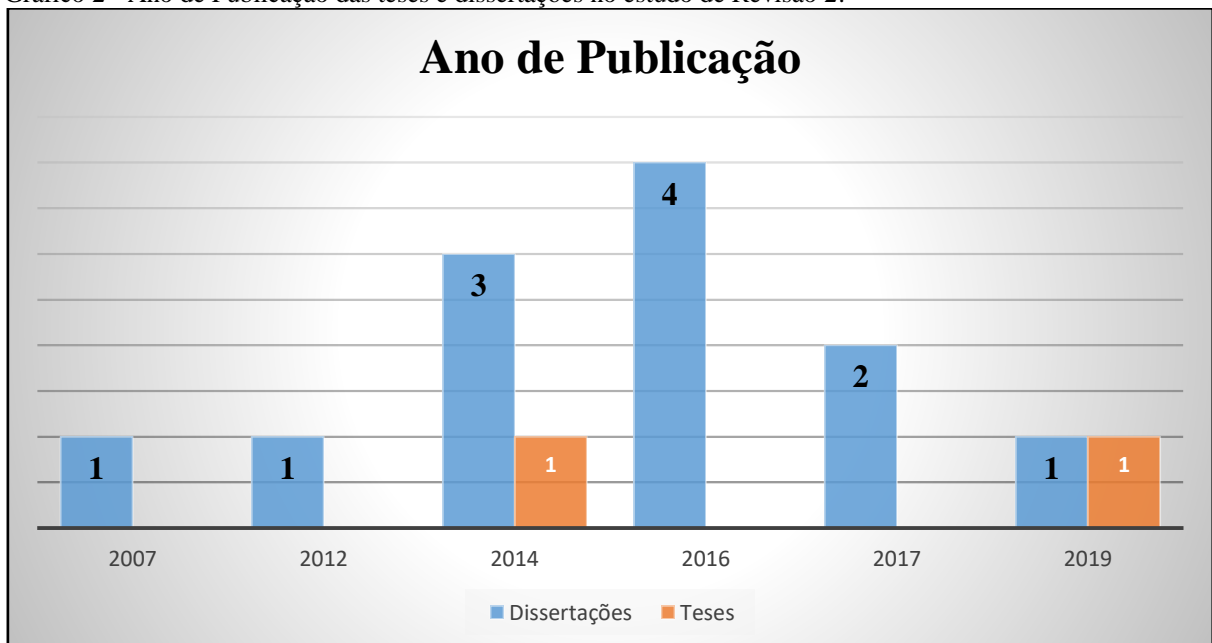
Gráfico 2 - Ano de Publicação das teses e dissertações no estudo de Revisão 2.

Iniciamos pela apresentação do Gráfico 2, que ilustra a distribuição das teses e dissertações por ano de publicação. O gráfico apresentado mostra que o ano de 2016 apresentou o maior número de trabalhos – quatro estudos (dissertações); em 2014 quatro estudos, sendo (três dissertações e uma tese) no ano de 2017 encontramos duas dissertações, nos anos de 2007 e 2012 encontramos uma dissertação e no ano de 2019 encontramos uma dissertação e uma tese.