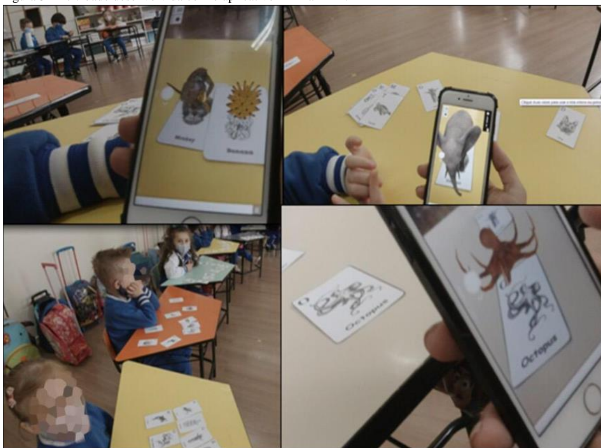
Figura 5 - Atividade desenvolvida com o aplicativo Animal 4D+.

Para essa atividade, inicialmente, distribuímos nove cartinhas de animais, e, em seguida, solicitamos que cada criança escolhesse quatro cartas para visualizar. Com o uso do celular da professora e de alguns tablets disponibilizados pela escola, passamos nas mesas das crianças para cada uma visualizar o animal escolhido. Essa ação está ilustrada na Figura 5.