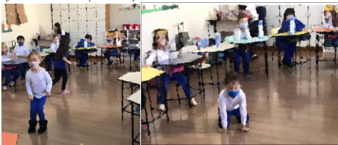
Figura 7 - Atividade de imitação e adivinhação dos animais.

Para finalizar, retornamos à sala de aula e realizamos uma brincadeira de imitação e adivinhação. Nessa brincadeira, as crianças puderam imitar o animal da floresta e o som que ele reproduz. A Figura 7 ilustra esse momento.