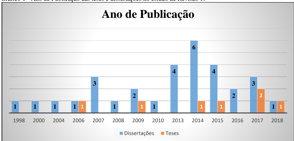
Gráfico 1 - Ano de Publicação das teses e dissertações no estudo de Revisão 1.

Iniciamos pela apresentação do Gráfico 1 que ilustra a distribuição das teses e dissertações por ano de publicação. O gráfico mostra que o ano de 2014 apresentou o maior número de trabalhos - sete estudos (seis dissertações e uma tese); seguido dos anos de 2015 com cinco trabalhos (quatro dissertações e uma tese) e do ano de 2017, com cinco estudos (três dissertações e duas teses). Nos demais anos o número de trabalhos foi inferior.