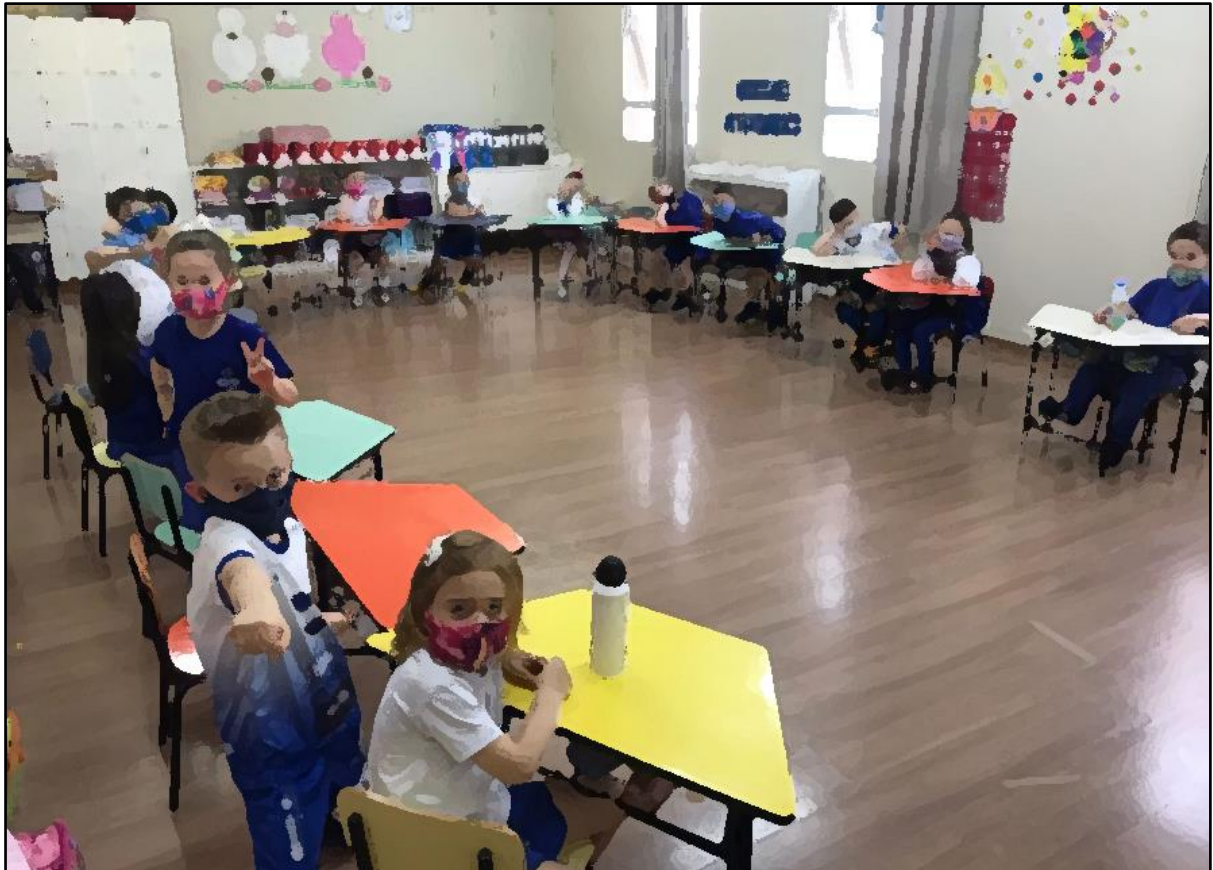
Figura 1 - Atividade de contação de história.

Com essa introdução, iniciamos as atividades da sequência didática, explicando que a atividade inicial envolveria a leitura de uma história – “Uma jornada pela floresta” –, que deveria ser ouvida com bastante atenção e que, na sequência, conversaríamos sobre o tema.