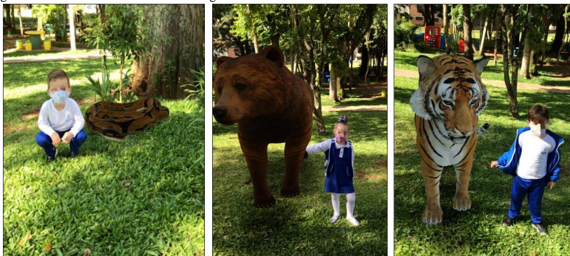
Figura 6 - Atividade realizada com o Google Realidade Aumentada.