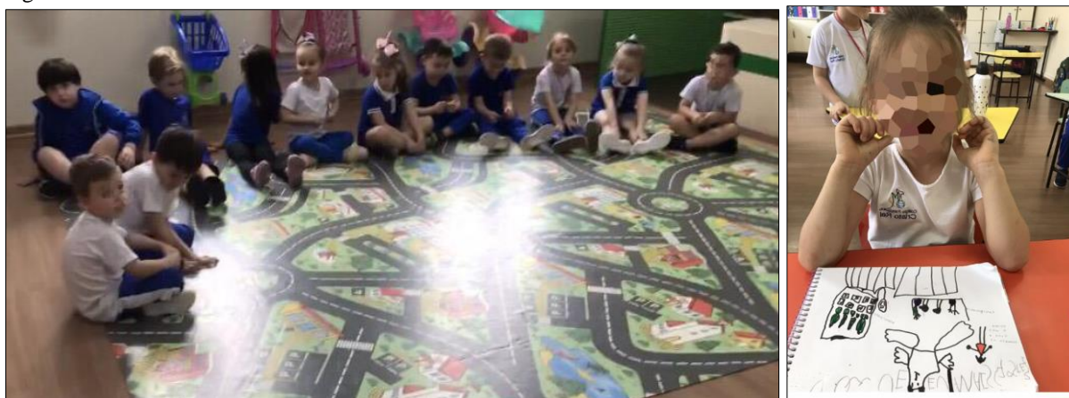
Figura 13 - Atividades desenvolvidas no último encontro.

Para finalizar, foi solicitado às crianças que desenhassem o que mais gostaram durante os sete encontros em que estudamos sobre os animais da floresta aplicadas. As imagens da Figura 13 são representativas desse último encontro.