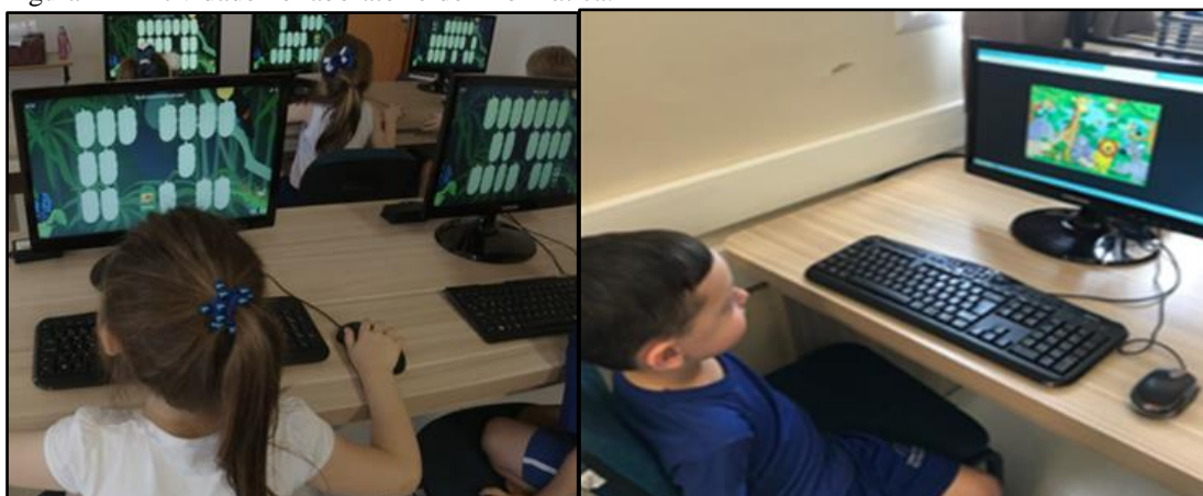
Figura 11 - Atividade no laboratório de informática.

Conforme cada criança concluía o jogo da memória, iniciava a atividade com o quebra-cabeças. Houve a necessidade de atendimentos mais individualizados nesse momento, uma vez que não se percebia uma familiaridade deles com o computador que estavam utilizando, nem mesmo agilidade em relação à movimentação do mouse. Alguns mostraram mais agilidade do que outros, mas todos demonstraram grande entusiasmo. A Figura 11 ilustra essas atividades desenvolvidas no laboratório de infomática.