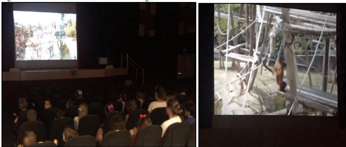
Figura 12 - Atividade de visita virtual ao zoológico.

Ao chegar em sala de aula, realizamos os momentos de acolhida, oração, rotina e identificação do ajudante. Em seguida, fomos para o centro de eventos do colégio e lá explicamos que participaríamos de uma visita virtual a um zoológico. Foi explicado às crianças que deveriam prestar bastante atenção, pois, ao final, eles teriam de responder a algumas perguntas sobre o conteúdo observado. A Figura 12 apresenta imagens desse momento.