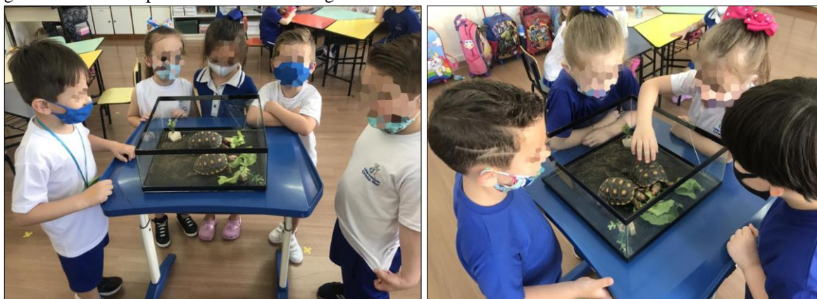
Figura 9 - Atividade para conhecer as tartarugas.