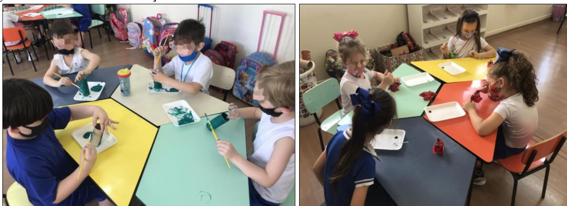
Figura 8 - Atividade de construção de animais com sucatas.

animais, sendo projetado um vídeo 3 com as fotos. Na sequência as crianças ficaram frente ao quadro e puderam escolher dentre quatro opções de animais da floresta qual desejariam construir - joaninha, sapo, cobra e a centopeia. Cada criança seguiu para a mesa para realizar a construção, como expressos pelos registros fotográficos da Figura 8.