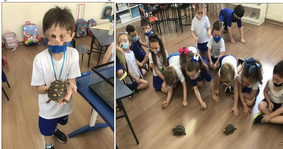
Figura 10 - Atividade manuseio das tartarugas.

Além de visualizar as tartarugas, os estudantes puderam alimentá-las com folhas de alface. As crianças tiveram a oportunidade de tocar nos animaizinhos e de brincar com eles. Alguns mostraram-se muito corajosos; outros, um pouco retraídos e com certa insegurança, acabaram apenas passando a mão no casco da tartaruga; outros, por fim, apenas observaram, sem tocá-las. A Figura 10 registra esse momento.