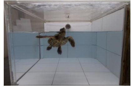
Una de las tortugas durante el experimento. JOSEPH PFALLER

1 No corren buenos tiempos para las tortugas marinas. Pese a que llevan nadando por los océanos de 2 la Tierra al menos 100 millones de años y un ejemplar puede alcanzar un siglo de vida, se encuentran 3 entre los animales más afectados por el cambio climático y la acidificación de los océanos, sus 4 caparazones y otras partes de sus cuerpos alcanzan altos precios en el mercado ilegal de especies 5 y la acumulación de plástico está provocando la muerte de muchas de ellas por atragantamiento o 6 porque quedan enredadas .