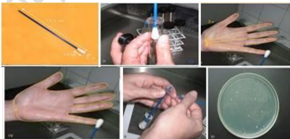
Figura 2: Coleta de amostra utilizando swab em mãos (Fonte: Andrade, 2005).