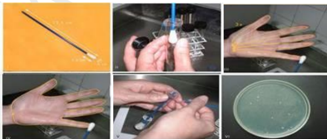
Figura 2: Coleta de amostra utilizando swab em mãos (Fonte: Andrade, 2005).